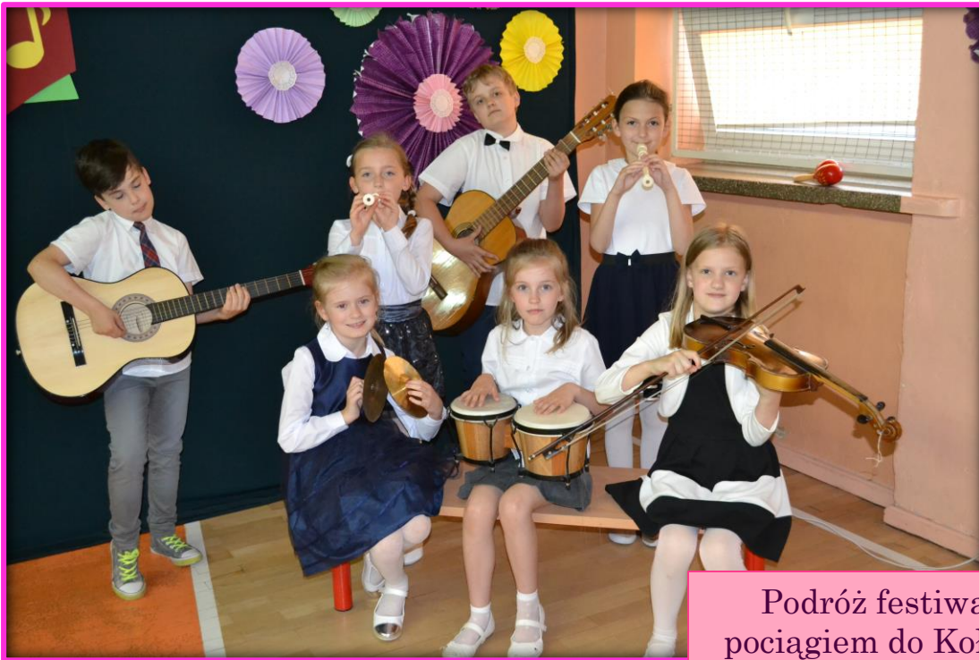
Podróż festiwalowym pociągiem do Kołobrzegu..